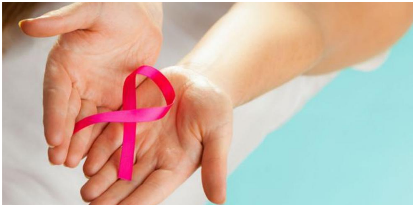
Día Mundial del Cáncer de Mama

Aragón diagnostica cada año una media de 900 casos de cáncer de mama, una patología cuyo día mundial se celebra mañana y para la que es vital la detección precoz