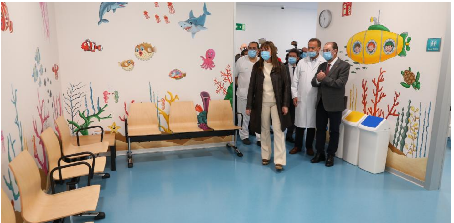
El Presidente de Aragón, Javier Lambán, y la consejera de Sanidad, Sira Repollés, visitan el servicio de Urgencias del Hospital Universitario San Jorge de Huesca

El Hospital San Jorge de Huesca estrenará su nuevo servicio de Urgencias el próximo 1 de marzo, unas instalaciones en las que se han invertido más de 5,8 millones de euros,