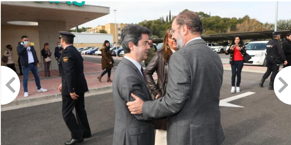
El Presidente de Aragón, Javier Lambán, y la consejera de Sanidad, Sira Repollés, visitan el servicio de Urgencias del Hospital Universitario San Jorge de Huesca

Por todo ello, el alcalde de Huesca, Luis Felipe, ha mostrado su agradecimiento por ser el Gobierno que más ha invertido nunca en infraestructuras sanitarias en la ciudad de Huesca, además de valorar la mejora de los equipamientos, que cumple el calendario reivindicativo.