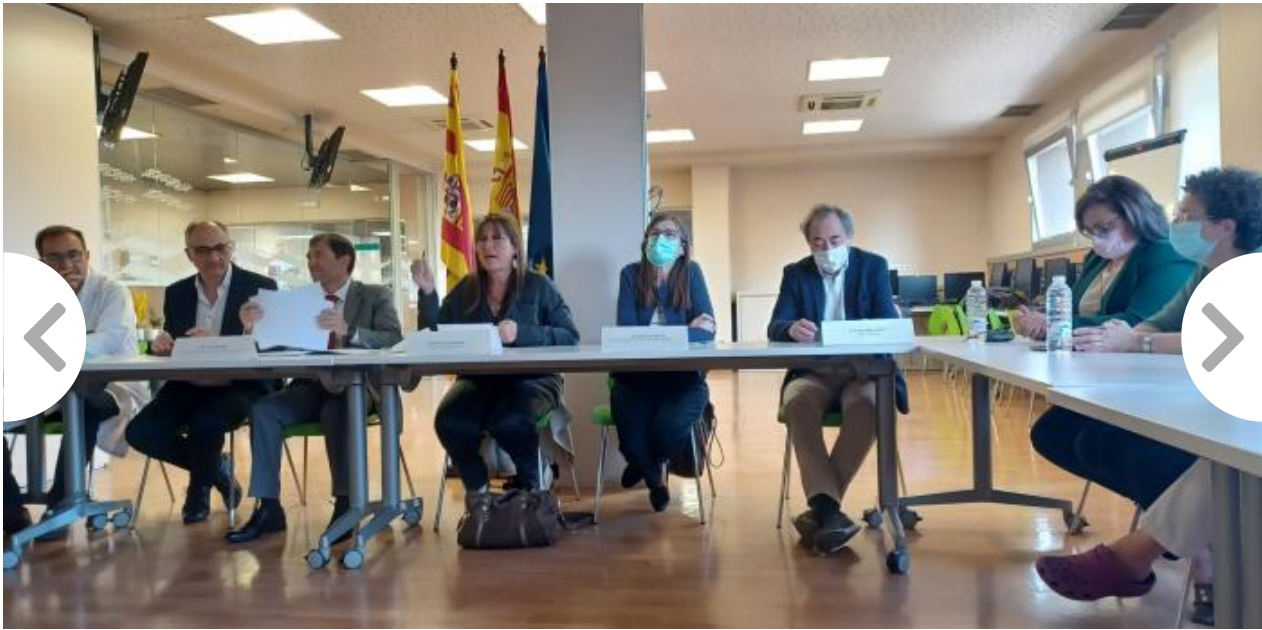
El Ministerio de Sanidad conoce las líneas de trabajo en salud digital de Aragón

Como parte de la reunión de trabajo, en la que se han detallado algunos servicios consolidados en Aragón, como el servicio de interconsulta virtual, anillo radiológico, atención telefónica o los planes personales de recuperación del trastorno mental grave, la delegación del Ministerio ha visitado posteriormente un Hogar de Personas Mayores y la residencia Joaquín Costa. En estos centros se ha realizado una demostración de este proyecto colaborativo de telemonitorización de pacientes.