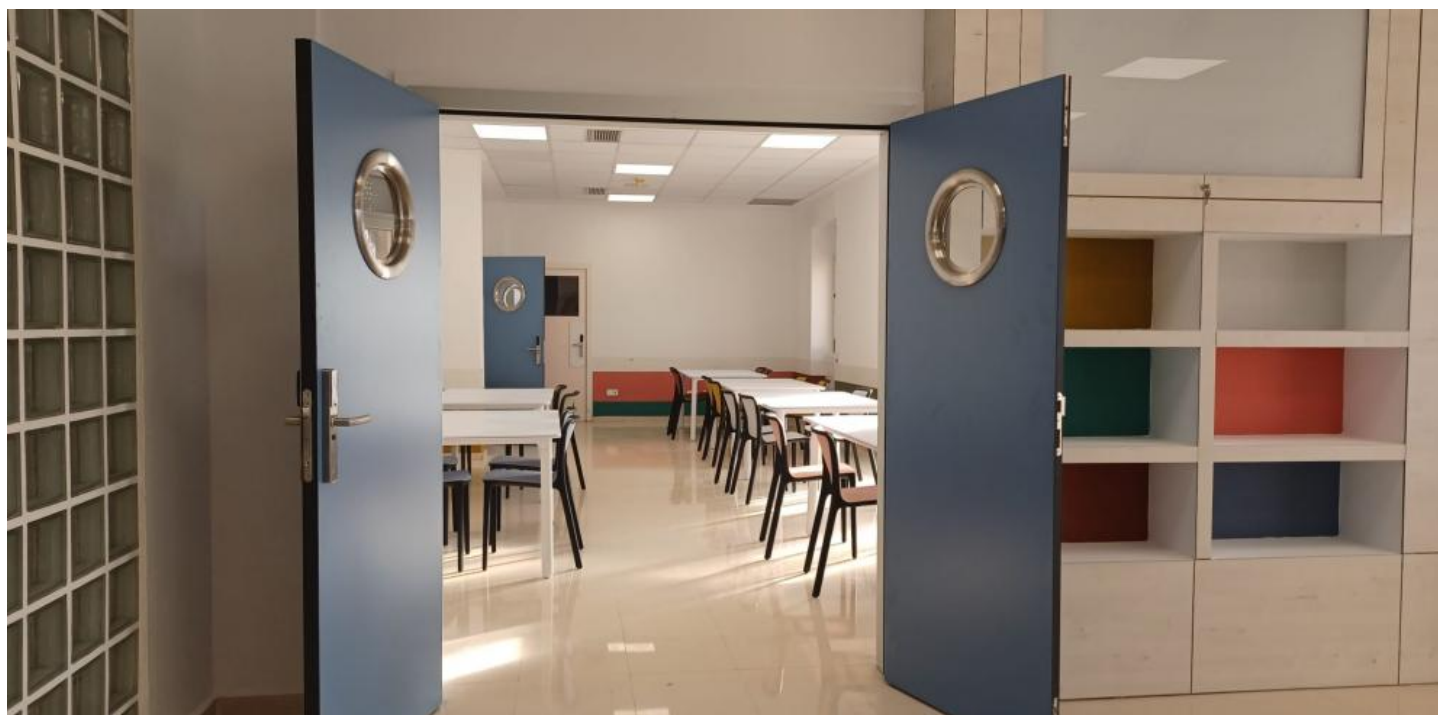
Estancias de la nueva planta de psiquiatría del Royo Villanova

Los pacientes de Psiquiatría del Hospital Royo Villanova de Zaragoza comenzarán la próxima semana a mudarse a la nueva y remodelada planta de este centro sanitario, tras finalizar las obras de reforma que permitirán implantar un nuevo modelo de hospitalización abierto. Este servicio atiende anualmente a unos 560 pacientes y registra alrededor de 7.600 estancias hospitalarias.