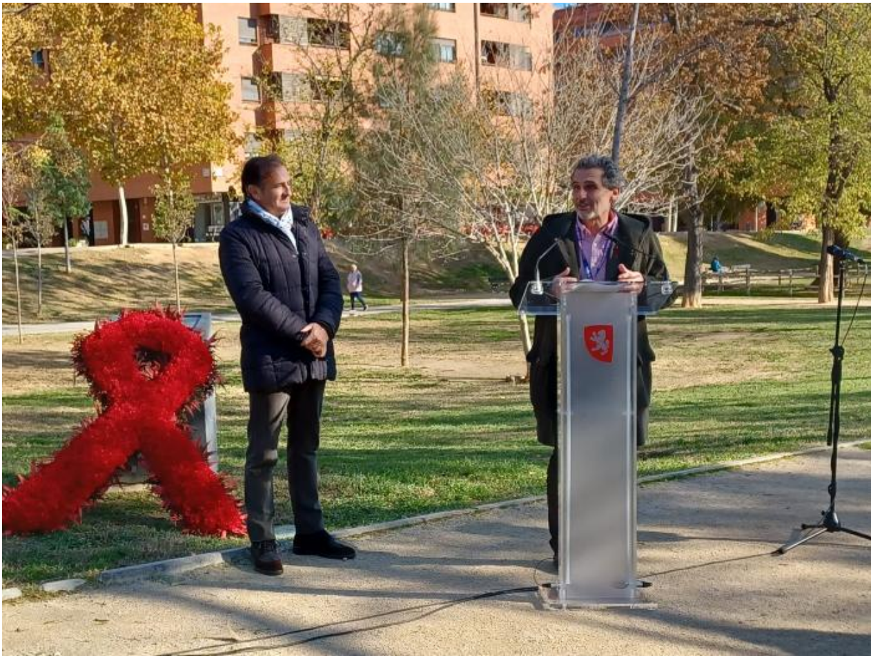
El director general de Salud Pública, Francisco Javier Falo, en su intervención.

Estas actuaciones van precisamente en la línea del lema Igualdad ya escogido por la ONU para esta edición del Día Mundial de la Lucha contra el SIDA, que propugna, entre otras iniciativas, la reforma de leyes, políticas y prácticas para abordar el estigma y la exclusión a los que se enfrentan las personas que viven con el VIH.