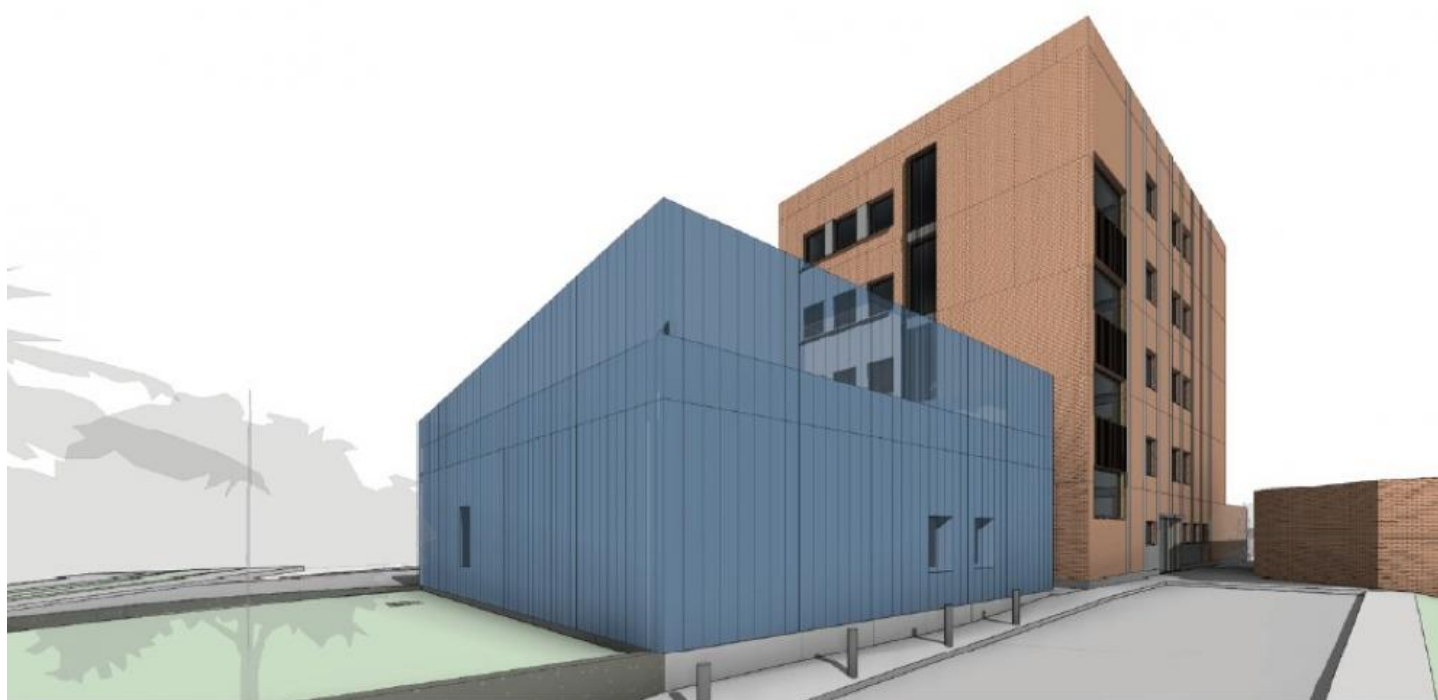
Recreación virtual del edificio anexo que se ubicará en el Hospital de Barbastro.