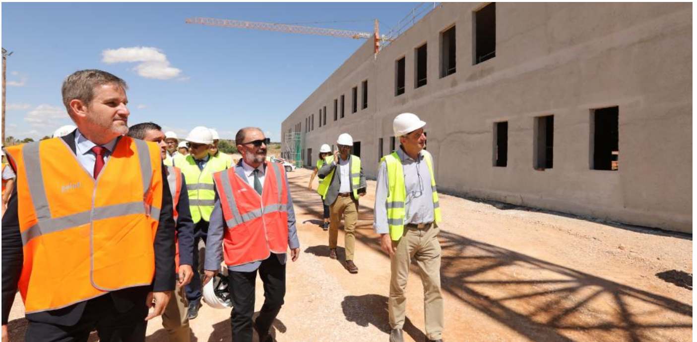
El presidente Javier Lambán visita las obras del Hospital de Alcañiz

Las obras de construcción del futuro del Hospital de Alcañiz se encuentran en estos momentos al 34,5% de ejecución y mantienen final de 2023 como plazo de finalización. Así lo han podido constatar hoy el presidente de Aragón, Javier Lambán, que ha visitado el estado de los trabajos junto a las consejeras de Presidencia y de Sanidad, Mayte