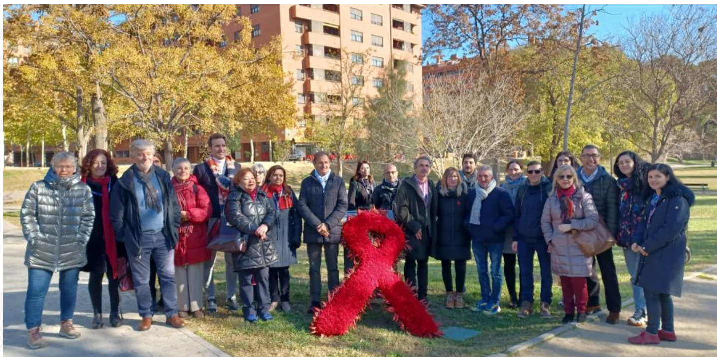
Foto de familia en el acto institucional con motivo del Día Mundial de la Lucha contra el SIDA. GOBIERNO DE ARAGÓN